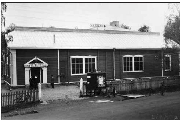
Lieksan suojeluskuntatalo Sarkala. Huomaa nimi katon harjalla.