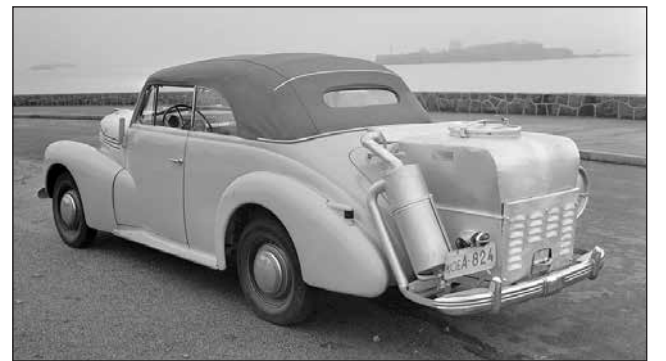
Häkäpönttöillä varustettu auto.