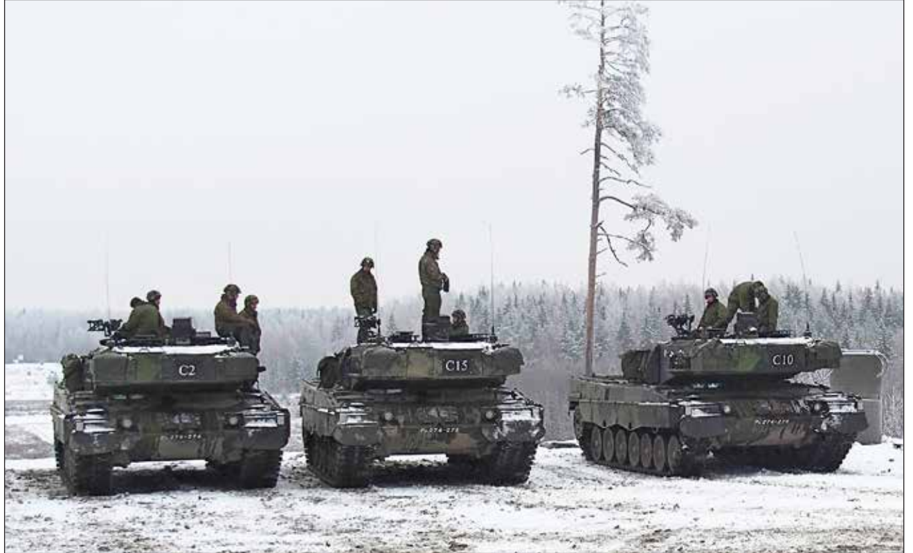
Psv-miehistö on saanut tehtäväksi tuhota 500 metrin päässä olevan psv-pesäkkeen.