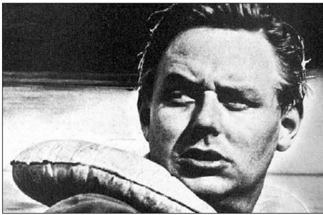
Stig-Olof Fagerström vuonna 1965.

S-O. muistaa myös elävästi, kuinka Moskovan Tiltu ilmoitti Neuvostoliiton radion Suomeen suunnatussa propagandälähetyksessä, että 6.2.1944 Helsinkiin olisi tulossa 200 pommikonetta ja 16.2. koneita olisi jo 400 ja 26.2. jopa 600 pommittajaa. Tiltu oli suomalaissyntyinen Aino Kallio , joka oli muuttanut Neuvostoliittoon ennen sotia.