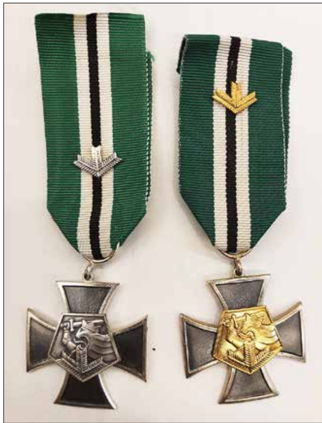
Kuvassa oikealla Sotilaspoikaristi, jossa on kullattu keskuskuvio. Vieressä harvinaisempi hopeoidulla keskuskuvioilla varustettu Sotilaspoikien Perinnekillan risti. Sitä ehdittiin jakaa vain kuusi kappaletta.