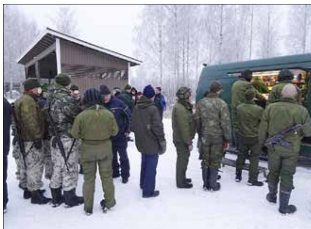
Hyvän suorituksen jälkeen maistuvivat perinteiset ”Sotkun” munkkikahvit.

Teksti: Lauri Toivanen