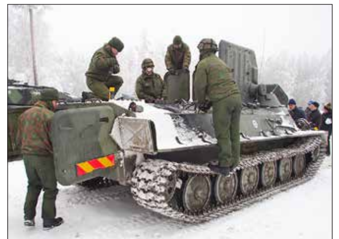
Tutustumiskohteena neuvostovalmisteinen kuljetuspanssarivaunu MT-LB.