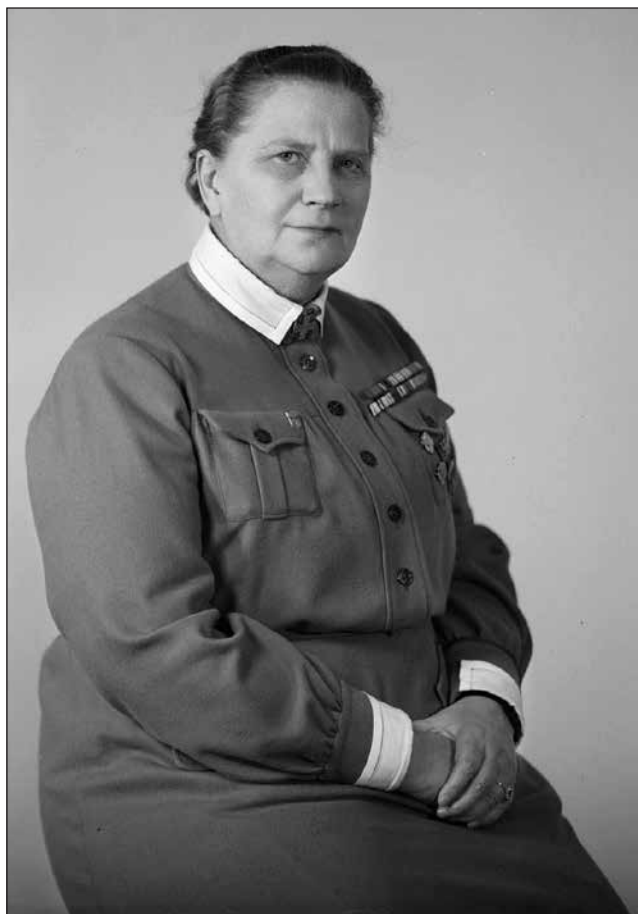
Fanni Luukkonen.

Iin Kruununsaaren hautausmaalle. Luukkonen johti Lotta Svärd -järjestöä vuodesta 1929 aina järjestön lakkauttamiseen saakka vuonna 1944.