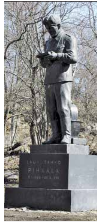
Tahkon patsas Helsingin Olympiastadionin puistossa.

sen kehittämä. Keksimisestä syntyi myös kiistaa, kun Oy Physica Ab toi markkinoille oman retkeilykompassinsa M/1:n. Voh-